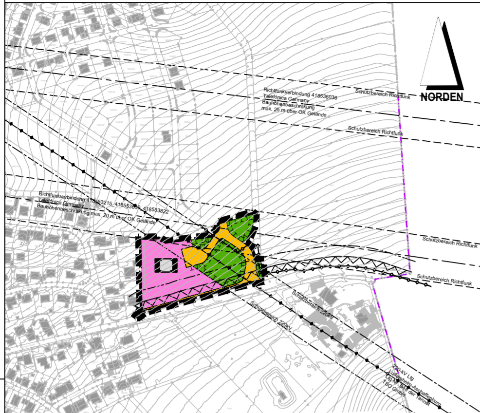
Auszug aus dem Flächennutzungsplan 14.02.2014